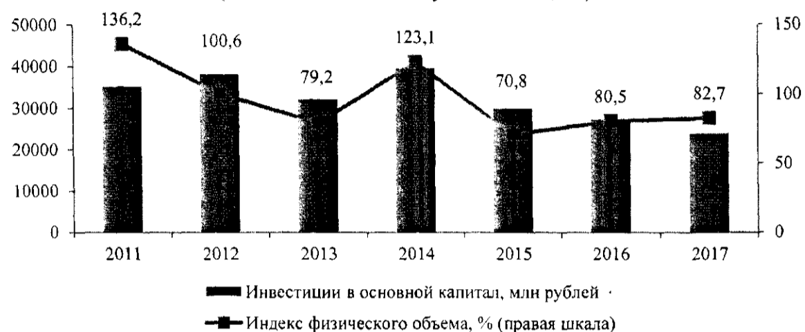
Динамика инвестиций в основной капитал, индекс физического объема в Республике Хакасия (в ценах соответствующих лет, %)

Снижение объема инвестиций в основной капитал в анализируемом периоде связано с зависимостью экономики региона от деятельности предприятий в сфере цветной и черной металлургии, добычи полезных ископаемых и производства электроэнергии, находящихся на территориях монопрофильных муниципальных образований (высокий уровень монопрофильности экономики).